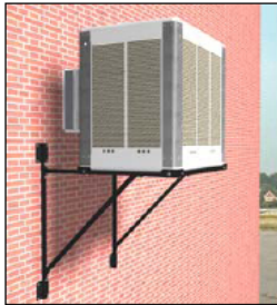
Equipo con impulsión del aire en posición horizontal "H"