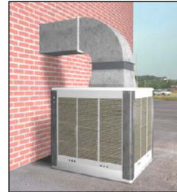
Equipo con impulsión del aire en posición vertical superior "VS"