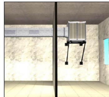
Equipo de impulsión del aire horizontal instalado en un local adyacente a la zona a climatizar.

(Realizar una abertura de 1m 2 por cada 10.000 m 3 /h de aire impulsados por el equipo).