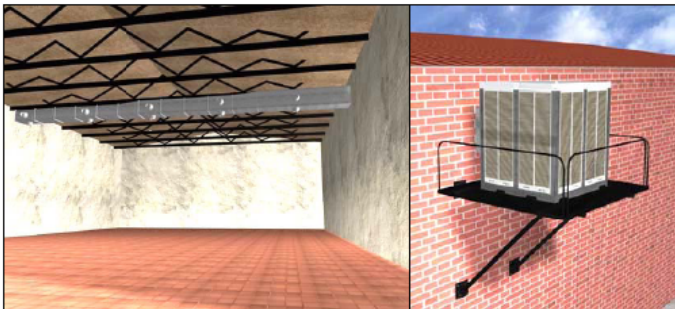
Equipo de impulsión del aire horizontal con red de conductos y conos orientables para la difusión del aire