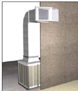
Equipo de impulsión del aire vertical superior con cubo difusor del aire a dos direcciones.