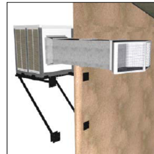
Equipo de impulsión del aire horizontal con cubo difusor de dos direcciones para la difusión del aire