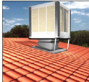
Equipo con impulsión del aire en posición vertical inferior "V"